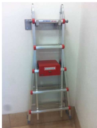
Beispiel einer möglichen Leitersicherung

Sind an eine Brandmeldezentrale nur automatische Brandmelder angeschaltet, so muss unmittelbar am FAT ein Druckknopfmelder angebracht werden.