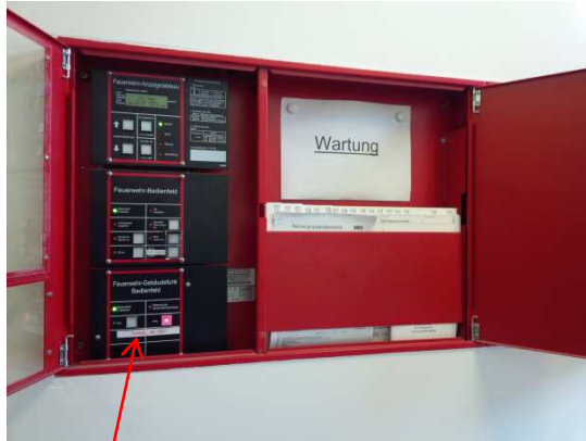
Gebäudefunk-Bedienfeld unter Feuerwehrbedienfeld