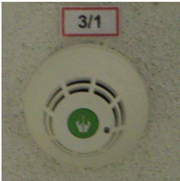
Beschilderung Meldergruppennummer / Meldernummer