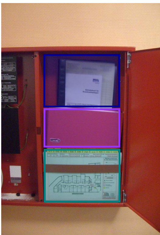
Betriebsbuch für Brandmeldeanlagen Feuerwehrpläne Feuerwehr-Laufkarten